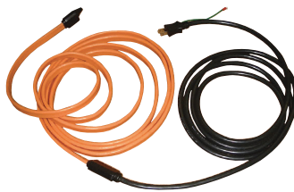
融雪や凍結防止、 温度管理等の用途で使用できます。

半導性チタン酸バリウムの PTC 効果とプラスチック断熱材を複合化することで、従来の樹脂系 PTC ヒーターでは実現できなかった、長尺で柔軟性のある自己出力制御型ヒーターを開発しました。